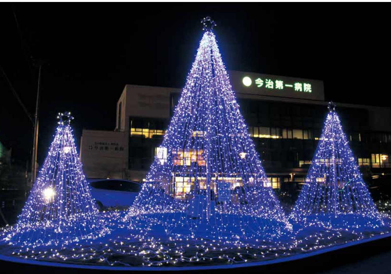
今治第一病院イルミネーション